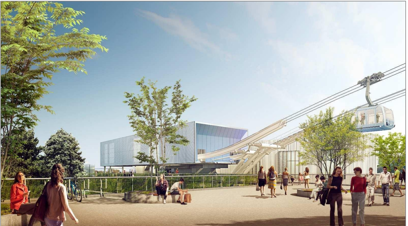
Groupement POMA / Architectes-urbanistes : SEQUENCES Station Oncopole

Les aérations présentes sur les cabines sont conçues de manière à rendre impossible tout jet d'objet sur les sites survolés. Chaque cabine est reliée par interphonie et vidéosurveillance à chacune des 3 stations.