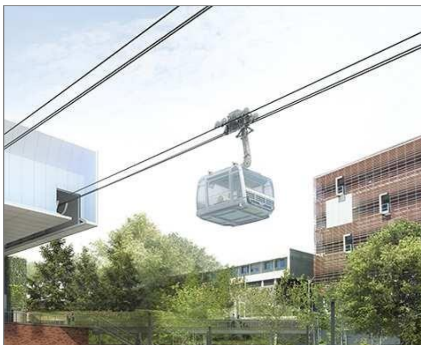
Groupement POMA / Architectes-urbanistes : SEQUENCES Station Rangueil

Fin 2020, ce mode de transport innovant sera mis en service. Il reliera l'université Paul Sabatier à l'Oncopole en passant par le CHU Rangueil. Son tracé d'une longueur de 3 km en fait le téléphérique urbain le plus long de France.