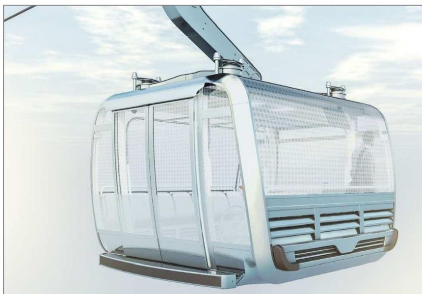
Exemple de design extérieur des cabines Groupement POMA